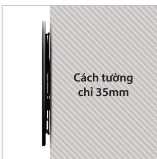
Thiết kế siêu mỏng treo màn hình cách tường chỉ 35mm