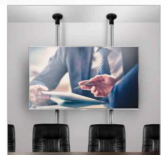
Tương thích với hệ thống vòng đai và ống của B-Tech để treo màn hình cỡ lớn trên ống