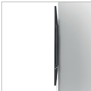
薄型的设计将屏幕安装在离墙30mm的位置上