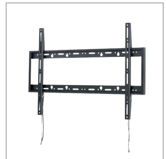
包括所有安装硬件