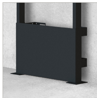
Sichere Verankerung an Boden und Wand für eine dauerhafte Installation