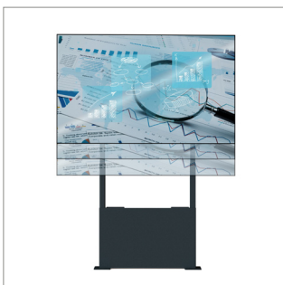
Reichweite der Höheneinstellung bis zu 650mm