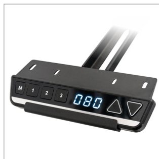
Lieferung mit einer Kabelfernbedienung