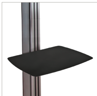
Kompatibel mit System 2-Zubehör wie Ablagen ohne Verwendung von Schellen