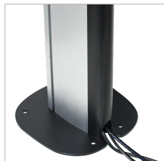
Die kleine Bodenplatte ist ideal für Vitrinen und die integrierte Kabelführung sorgt für Ordnung