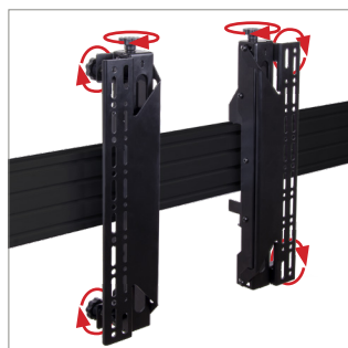
Werkzeuglose Feinjustage für nahtlose Montagen des Bildschirms