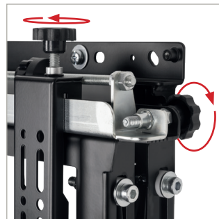
Met fijnafstelling op 8 punten voor een naadloze display-uitlijning