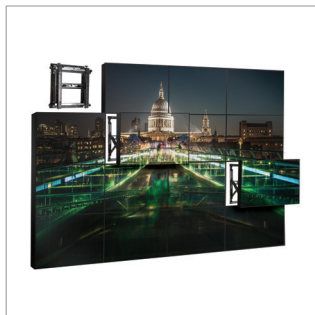
Het modulaire montagesysteem maakt een ongelimiteerd aantal configuraties mogelijk

*Let op: bij gebruik van de inbegrepen adapterarmen voor VESA 600 x 400-schermen zal de totale diepte van het product met 6mm toenemen, voor een totale diepte van 107mm, of 299mm wanneer in open positie (+/-7mm fijnafstelling).