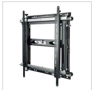
Interface-adapters voor VESA 600 x 400 zijn standaard inbegrepen