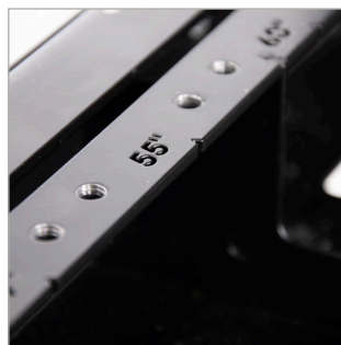
Guía con tamaño de pantalla para ajustar el soporte para que se adapte a todas las pantallas de 32"-70"