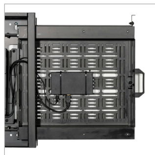
En posición abierta se puede acceder, quitar o añadir todos los accesorios sin quitar la pantalla